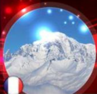
France - Mont Blanc 4811m