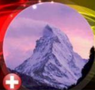
Suisse - Le Cervin 4478m