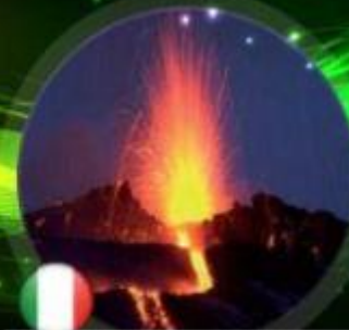
Italie - Etna 3330m