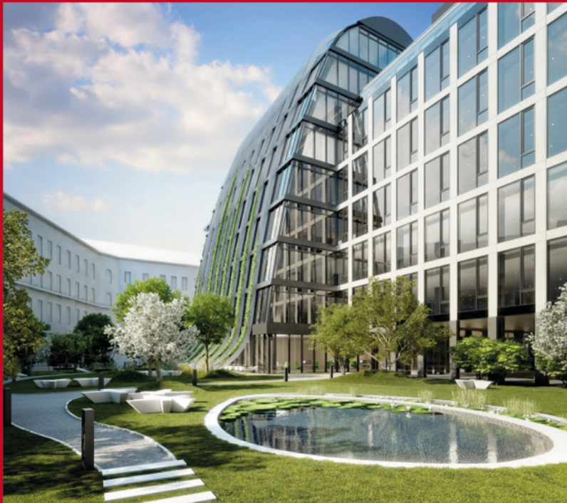
Florentinum Prague 2014

Ils nous recevront dans leur bureau pour nous faire part de leur passion, puis ils nous présenteront certaines de leurs réalisations sur le terrain.